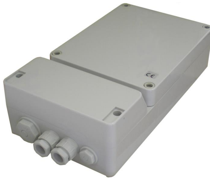
Abb. 1: BA-25, Zusatzverstärker für Tischsprechstellen (L-Nr.: 2525)

Zum Anschluss von 100V-Lautsprechern mit bis zu 25W Leistung